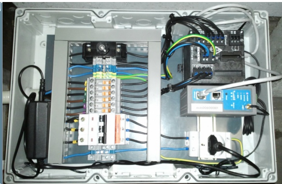
SICAM MMU im eingebauten Zustand