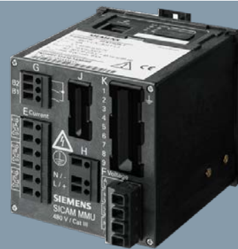
SICAM MMU (Measurement and Monitoring Unit)