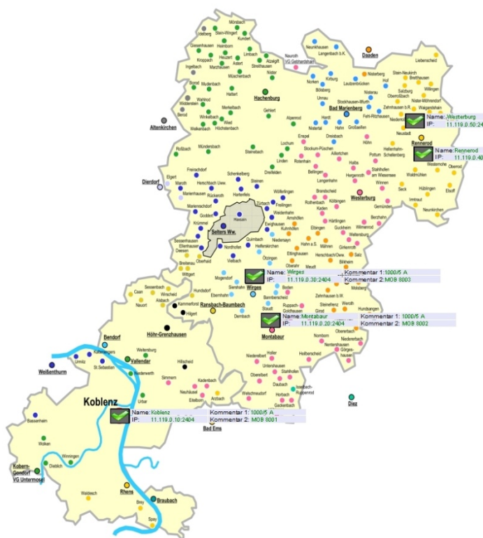
Netzausbau der Energienetze Mittelrhein GmbH