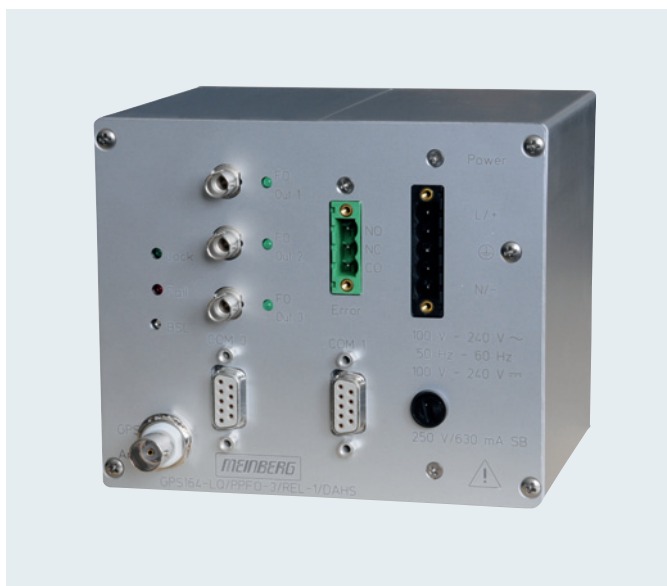
Abb. 13/126 GPS-Zeitsynchronisiereinheit 7XV5664-1