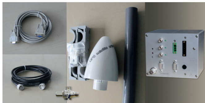
Fig. 13/127 Zusatzkomponenten