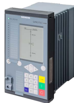
Transformator-differentialschutz SIPROTEC 7UT82 (1/3 x 19")