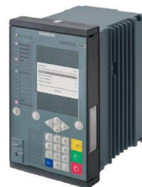
SIPROTEC 5 - multifunktionales Schutzgerät

SIPROTEC 5-Geräte erfüllen die Niederspannungsrichtlinie 2014/35/EU. Die Spannungsmesseingänge haben gemäß EN 60255-27:2014 (Messrelais und Schutzeinrichtungen Anforderungen an die Produktsicherheit) eine Bemessungsisolationsspannung von maximal AC 300 V. Die AC 400 V Messspannungen darf nicht direkt an SIPROTEC 5-Geräte angeschlossen werden. Für den Einsatz in der Niederspannung erfolgt die Anpassung der Messspannung durch vorgeschaltete Spannungsteiler und Einstellung der Geräteparameter.