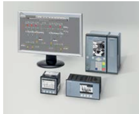
SICAM Power Quality und Measurement

Retrofit ist mehr als ein Gerätetausch: Messen, Aufzeichnen, Analysieren und Verbessern – mit dieser kontinuierlichen Maßnahmenschleife steigern Sie die Spannungsqualität und vermeiden unnötige Kosten. Unsere Retrofit-Maßnahmen sorgen mit Class-A-Messgeräten durch ein festgelegtes Messverfahren nach der Norm IEC 61000-4-30 für garantiert vergleichbare Messungen. Mit diesen Eigenschaften sind die SICAM Power Quality Geräte zusätzlich auch für gerichtsverwertbare Power-Quality-Compliance-Messungen prädestiniert.