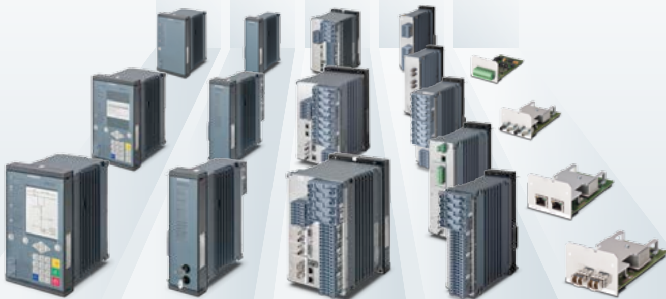
Painéis de operação local para módulos básicos