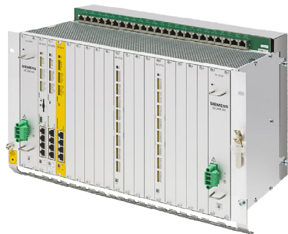
SICAM AK 3 (Ausführung: 17 teiliger Baugruppenträger)

Im kritischen Infrastrukturbereich unterliegen Automatisierungsgeräte hohen Anforderungen bezüglich sich ständig weiter entwickelnder Cyber Security. Auch in dieser Hin-