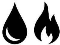
Oil and Gas

Mit SICAM Q100 (Klasse A incl. RVC Erkennung) und SICAM P855 (Klasse S) PQ-Geräten kann die Fehlerursache eindeutig bestimmt werden. Die Auswertung der Netzqualitätsdaten und Störschriebe erfolgt mit dem integrierten Webbrowser und sorgt somit für eine schnelle Lokalisierung der Fehlerursache.