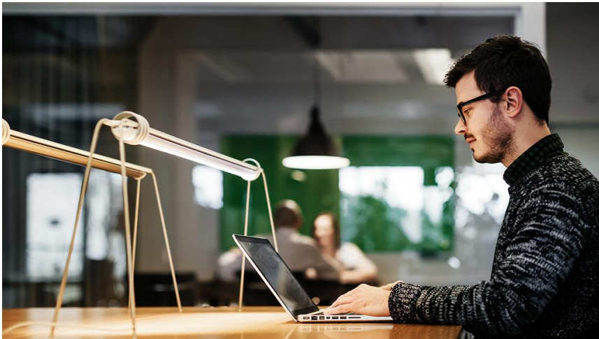
Das richtige Hotelzimmer für Ihre Weiterbildung: schnell und einfach gebucht über das neue HRS-Buchungstool.